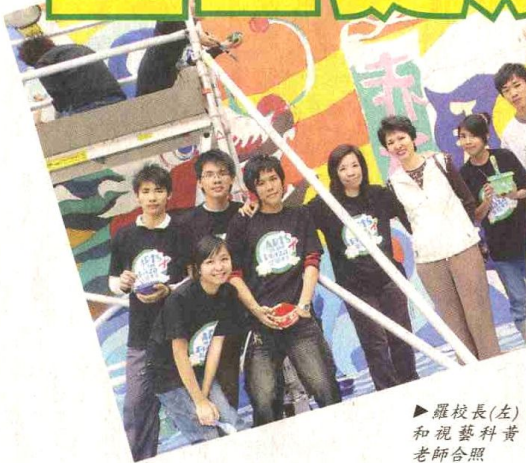
▶ 羅校長(左)和視藝科黃老師合照