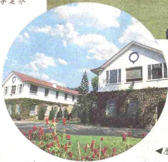
▲歷史的遺產，遼闊的校園。