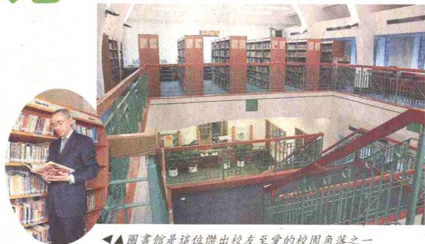
▲圖書館是這位傑出校友至愛的校園角落之一