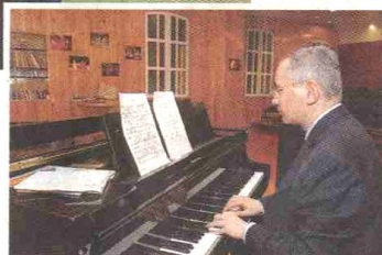
▲音樂老師的勉勵說話，今天仍留在他心裏。